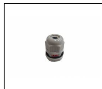
Dławnica odpowietrzająca różne szara M20*1.5 IP68 (16000507)