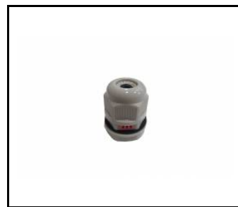
Dławnica odpowietrzająca różne szara M20*1.5 IP68 (16000507)