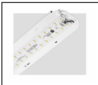
TYTAN MULTI LED 1450mm 3150-5450lm 840 - moduł świetlny (358951)