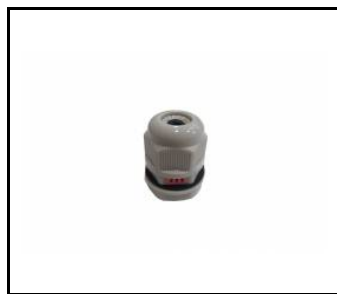
Dławnica odpowietrzająca różne szara M20*1.5 IP68 (16000507)