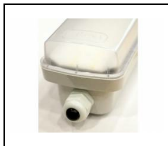
Zaślepka dławnicy M16 różne PA czarna M-16 - BPM-21 (60000006)