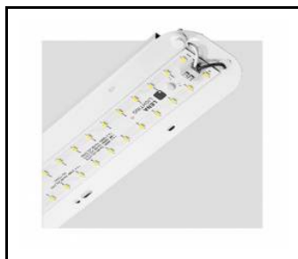
TYTAN MULTI LED 1150mm 5000-8700lm 840 - moduł świetlny (358944)