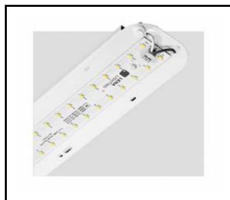
TYTAN MULTI LED 1450mm 3150-5450lm 840 - moduł świetlny (358951)