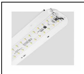
TYTAN MULTI LED 1450mm 3150-5450lm 840 - moduł świetlny (358951)