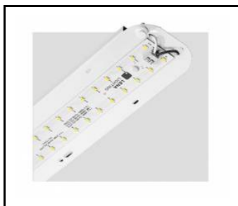
TYTAN MULTI LED 1150mm 5000-8700lm 840 - moduł świetlny (358944)