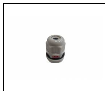
Dławnica odpowietrzająca różne szara M20*1.5 IP68 (16000507)