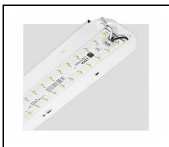
TYTAN MULTI LED 1450mm 3150-5450lm 840 - moduł świetlny (358951)