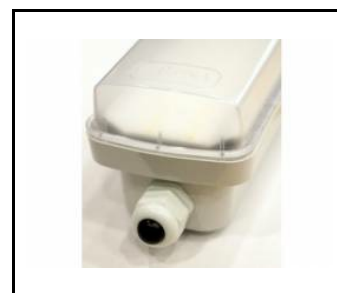
Zaślepka dławnicy M16 różne PA czarna M-16 - BPM-21 (60000006)