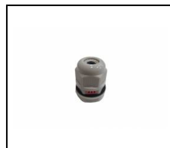
Dławnica odpowietrzająca różne szara M20*1.5 IP68 (16000507)