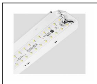
TYTAN MULTI LED 1150mm 5000-8700lm 840 - moduł świetlny (358944)