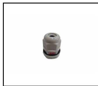
Dławnica odpowietrzająca różne szara M20*1.5 IP68 (16000507)