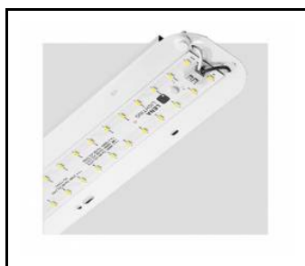
TYTAN MULTI LED 1150mm 2500-4300lm 840 - moduł świetlny (358937)