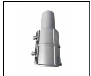
Uchwyt regulowany Astra LED/Astra LED BASIC aluminium szary RAL 9006 fi 64mm Corona 2 led (UL00214)