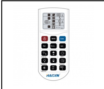
Pilot do programowania RC HAI HD05R do HD0406VRH IoT (WSEL431)