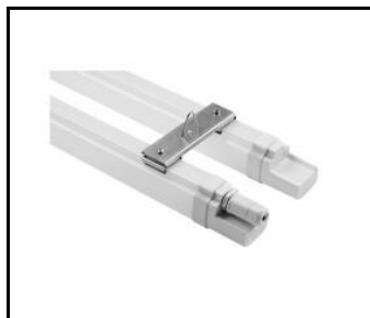
MIMO 2 LED - Halterung doppelt (kpl) (100673)