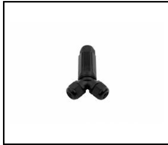
Klemme IP68 High-bay PA 6.6 schwarz DL06-3A-2Y (800ML208)

Erstellungsdatum der Karte: 08 Januar 2025