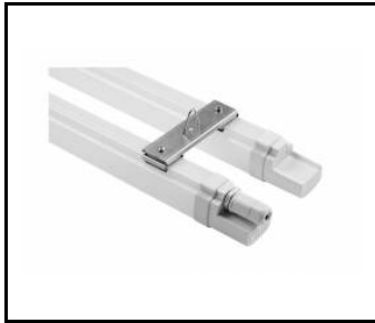
MIMO 2 LED - Halterung doppelt (kpl) (100673)