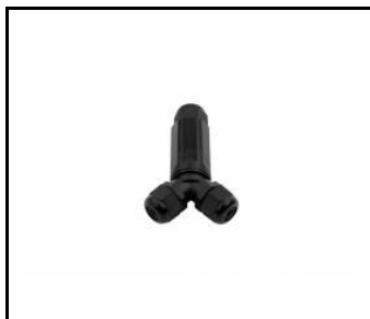
Złączka IP68 High-bay PA 6.6 czarna DL06-3A-2Y (800ML208)