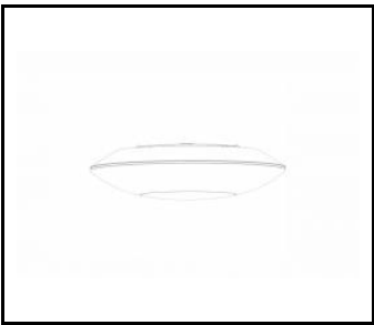
CAPELLA LED EDGE

DETAILLIERTE PRODUKTKARTE TECHNISCHE DATEN