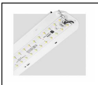
TYTAN LED 1150mm 2500lm 840 - moduł świetlny (2018.09) (909016)