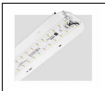
TYTAN LED 1150mm 2300lm 830 - moduł świetlny (2018.09) (909009)