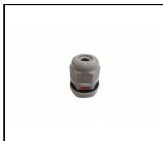
Dławnica odpowietrzająca różne szara M20*1.5 IP68 (16000507)