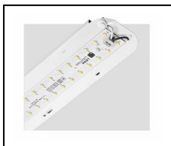
TYTAN LED 1150mm 2300lm 830 - moduł świetlny (2018.09) (909009)