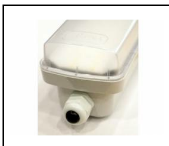
Zaślepka dławnicy M16 różne PA czarna M-16 - BPM-21 (60000006)

Data utworzenia karty: 20 październik 2022