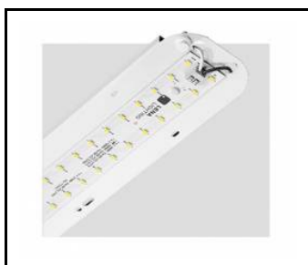
TYTAN LED 1150mm 2500lm 840 - moduł świetlny (2018.09) (909016)