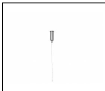
Tube LED EVO zawiesie linkowe (266607)