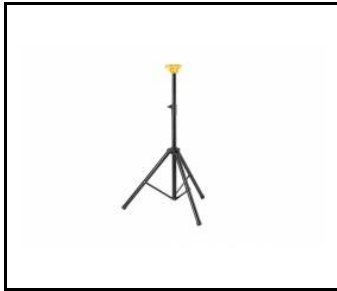
FUTURE STAND Černý stojan 2 m se systémem Click Head (000737)