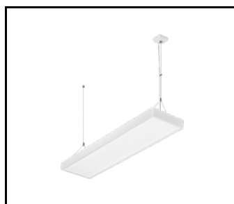
CONTRA LED závěsný systém 1200x300 (374692)