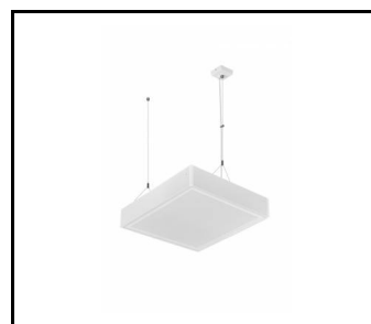
Závěsný systém CONTRA LED 600x600 (374685)