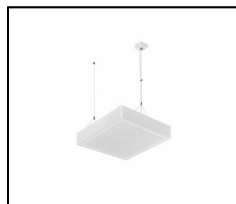
Système de suspension CONTRA LED 600x600 (374685)