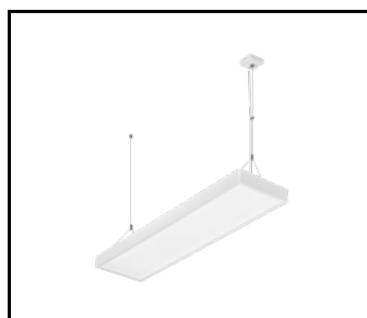
CONTRA Système de suspension LED 1200x300 (374692)