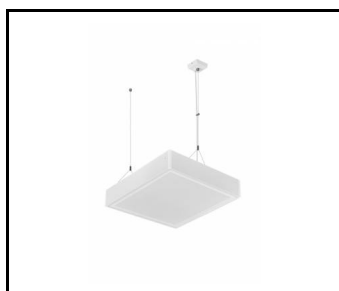
CONTRA LED-Pendelsystem 600x600 (374685)