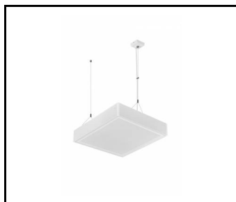
CONTRA LED-Pendelsystem 600x600 (374685)