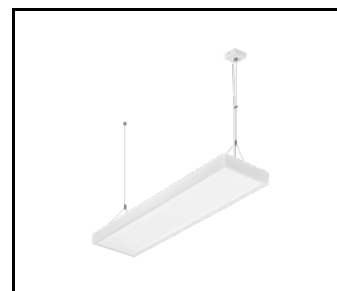
CONTRA LED-Pendelsystem 1200x300 (374692)