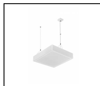
CONTRA LED-Pendelsystem 600x600 (374685)