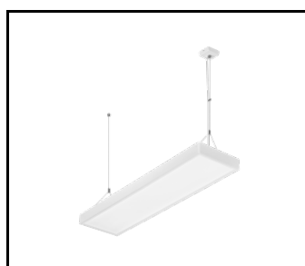
CONTRA LED-Pendelsystem 1200x300 (374692)