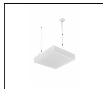
CONTRA LED-Pendelsystem 600x600 (374685)