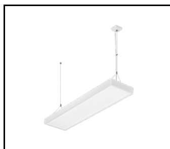
CONTRA LED-Pendelsystem 1200x300 (374692)