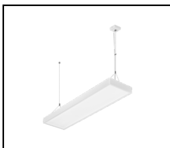
CONTRA LED system zwieszania 1200x300 (374692)