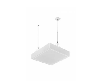
CONTRA LED system zwieszania 600x600 (374685)