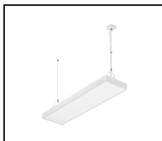
CONTRA LED system zwieszania 1200x300 (374692)