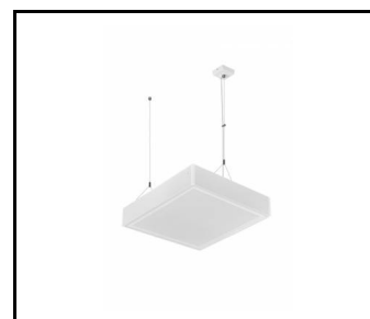
CONTRA LED system zwieszania 600x600 (374685)