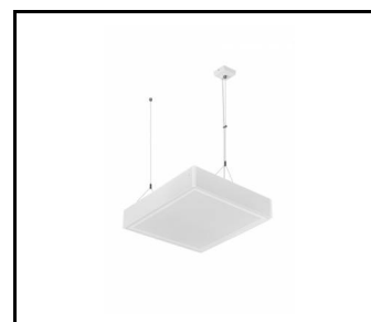
CONTRA LED system zwieszania 600x600 (374685)