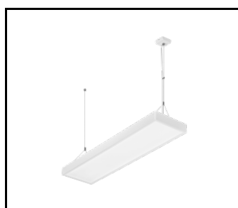
CONTRA LED system zwieszania 1200x300 (374692)