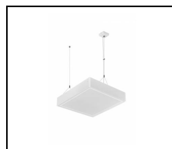
CONTRA LED system zwieszania 600x600 (374685)