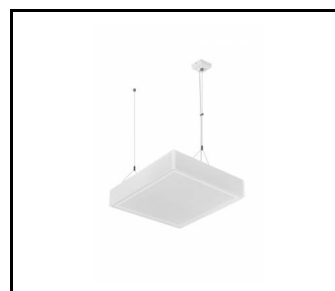
CONTRA LED system zwieszania 600x600 (374685)