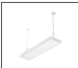
CONTRA LED system zwieszania 1200x300 (374692)