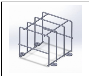
Schutzgitter Sensor Hytronik HIM84 RAL 9003 (598913)

Erstellungsdatum der Karte: 20 März 2026