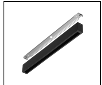
Terrano Oberfläche Rahmen schwarz matt RAL9005 573x38x60 (420948)