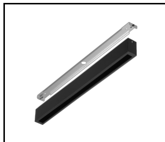
Cadre de surface Terrano noir mat RAL9005 573x38x60 (420948)