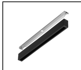
Cadre de surface Terrano noir mat RAL9005 573x38x60 (420948)