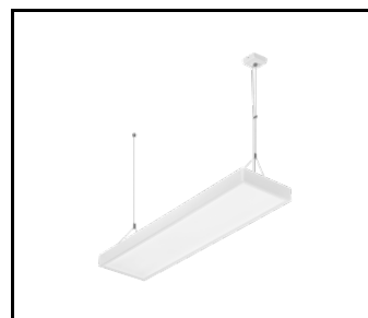
CONTRA LED závěsný systém 1200x300 (374692)