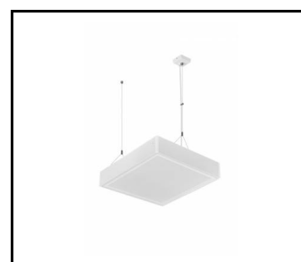
Závěsný systém CONTRA LED 600x600 (374685)