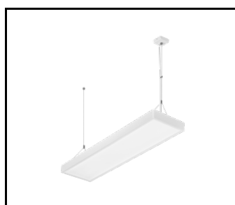
CONTRA LED závěsný systém 1200x300 (374692)