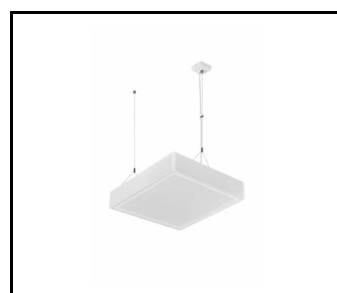
Závěsný systém CONTRA LED 600x600 (374685)