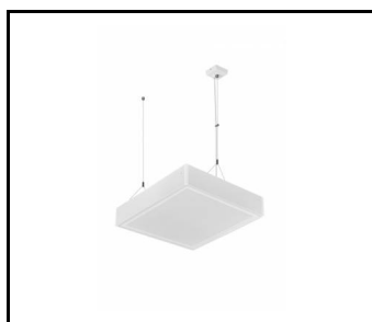
Závěsný systém CONTRA LED 600x600 (374685)