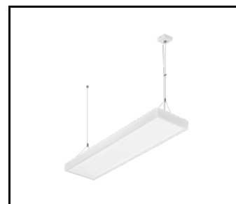
CONTRA LED závěsný systém 1200x300 (374692)