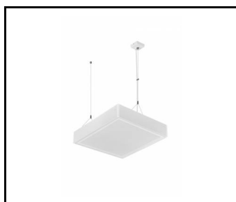
Závěsný systém CONTRA LED 600x600 (374685)