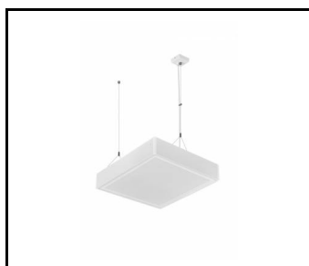
Système de suspension CONTRA LED 600x600 (374685)