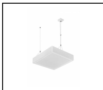
Système de suspension CONTRA LED 600x600 (374685)