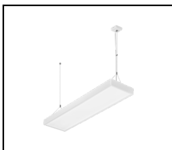
CONTRA Système de suspension LED 1200x300 (374692)