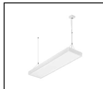
CONTRA Système de suspension LED 1200x300 (374692)