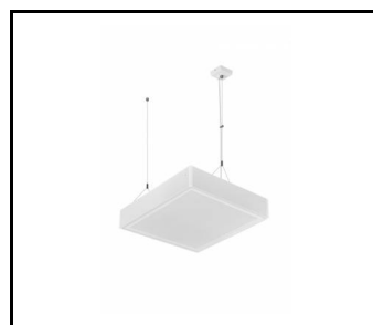
Système de suspension CONTRA LED 600x600 (374685)