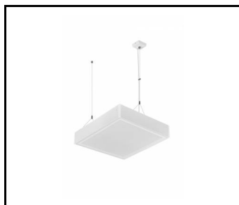
Système de suspension CONTRA LED 600x600 (374685)