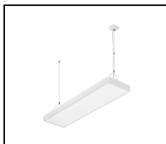
CONTRA LED-Pendelsystem 1200x300 (374692)