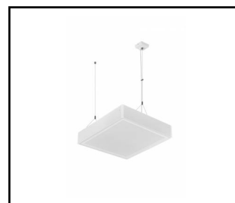
CONTRA LED-Pendelsystem 600x600 (374685)