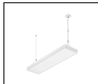
CONTRA LED-Pendelsystem 1200x300 (374692)