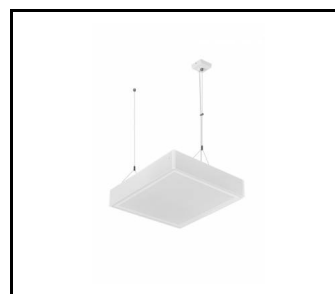
CONTRA LED system zwieszania 600x600 (374685)