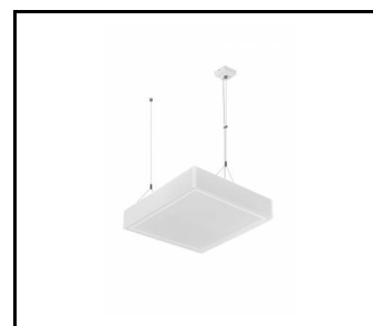
CONTRA LED system zwieszania 600x600 (374685)