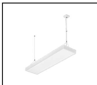
CONTRA LED system zwieszania 1200x300 (374692)