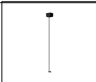
Baris 52 – Netzkabel schwarz DALI (318078)

Erstellungsdatum der Karte: 04 Dezember 2025