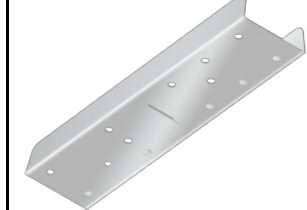
Baris 52 – Linearverbinder. gerade (318023)