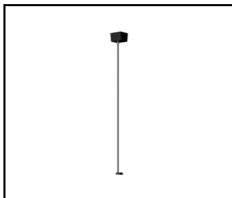
Baris 52 - zwiesie zasilające Dali czarne (318078)