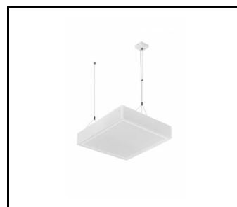
Závěsný systém CONTRA LED 600x600 (374685)