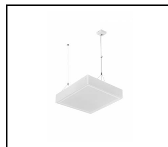
Závěsný systém CONTRA LED 600x600 (374685)