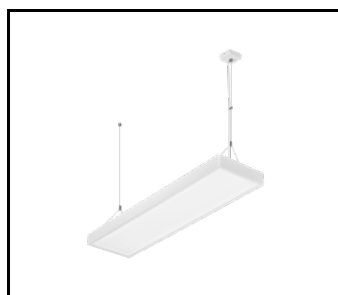
CONTRA LED závěsný systém 1200x300 (374692)