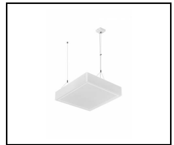
CONTRA LED-Pendelsystem 600x600 (374685)