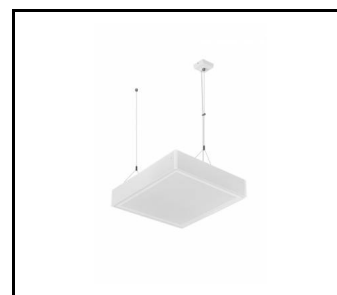
CONTRA LED-Pendelsystem 600x600 (374685)