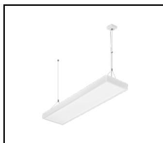
CONTRA LED-Pendelsystem 1200x300 (374692)