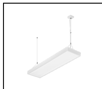
CONTRA LED-Pendelsystem 1200x300 (374692)