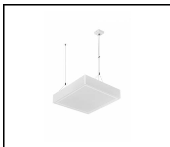
CONTRA LED-Pendelsystem 600x600 (374685)